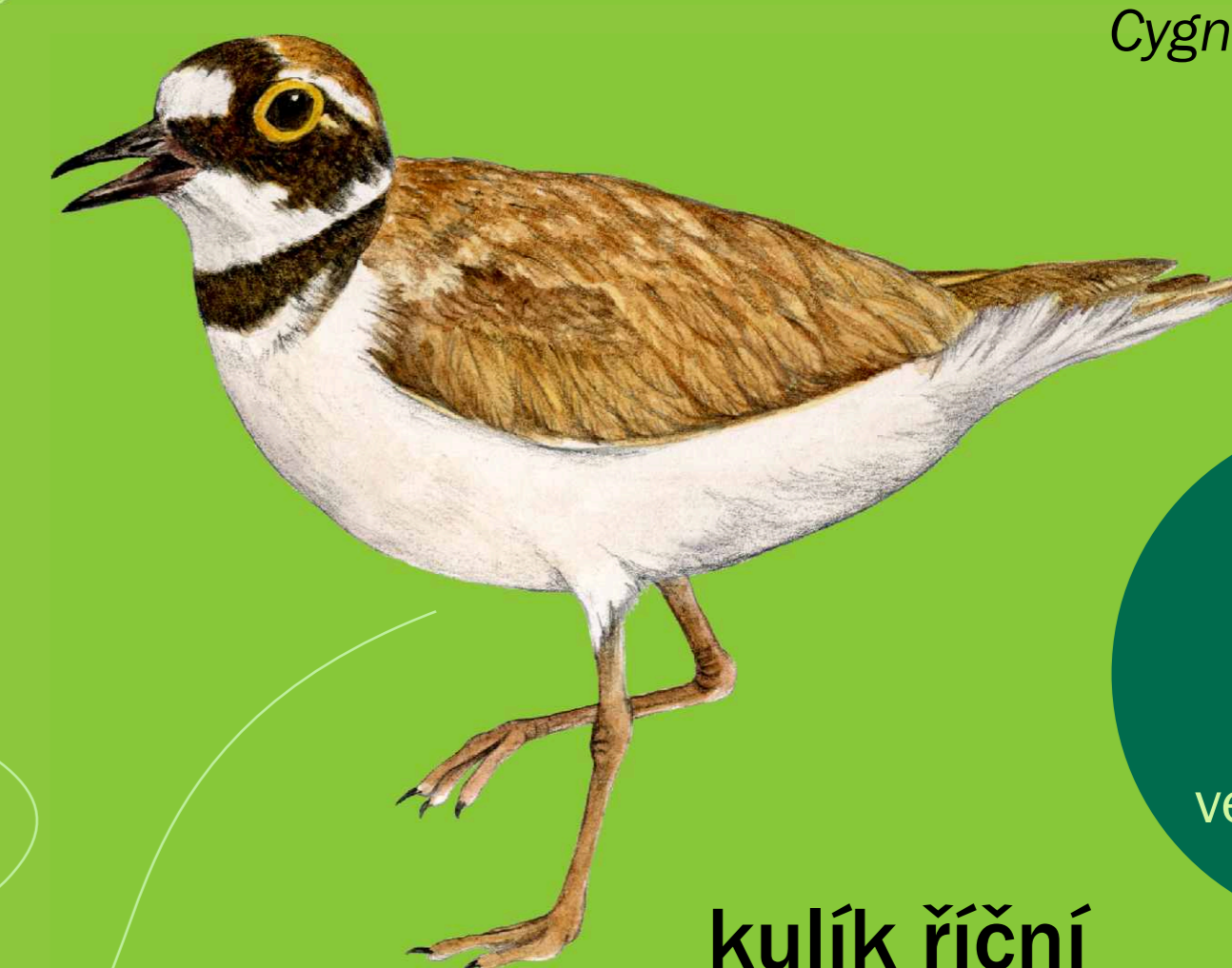
kulík říční Charadrius dubius