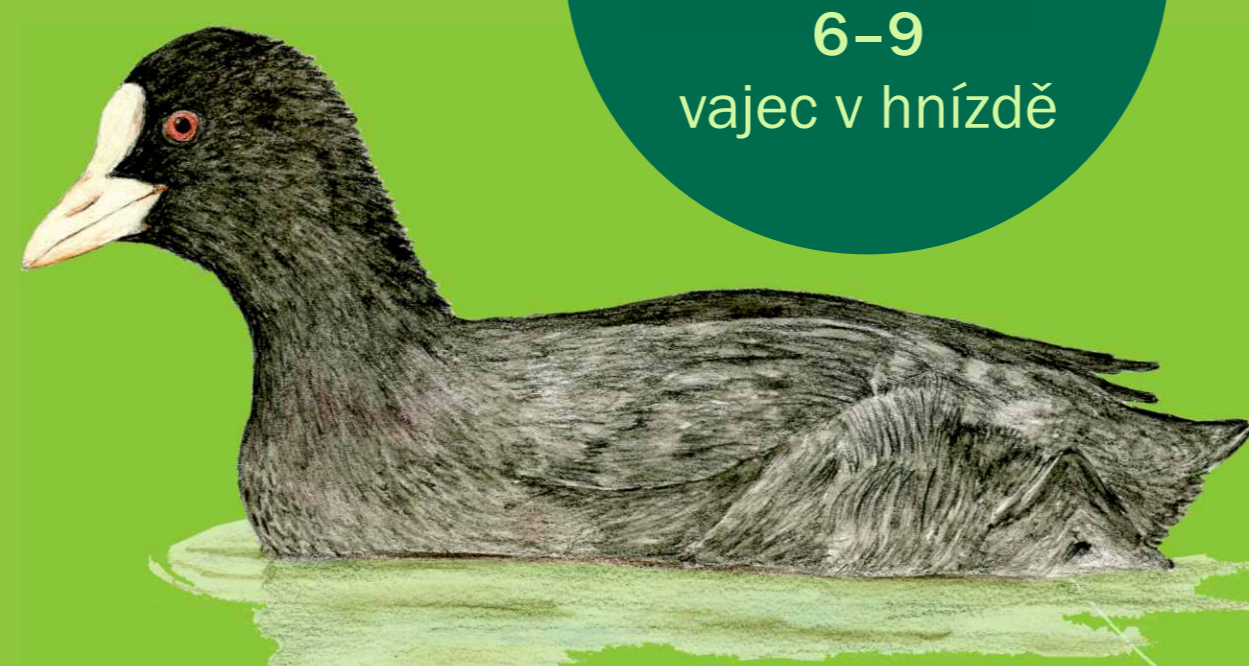
lyska černá Fulica atra