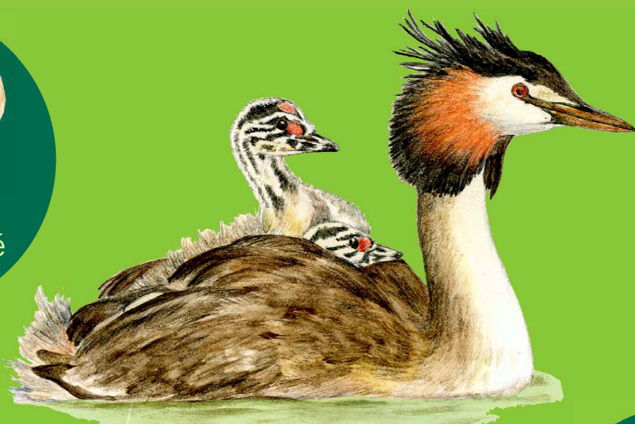
potápka roháč Podiceps cristatus