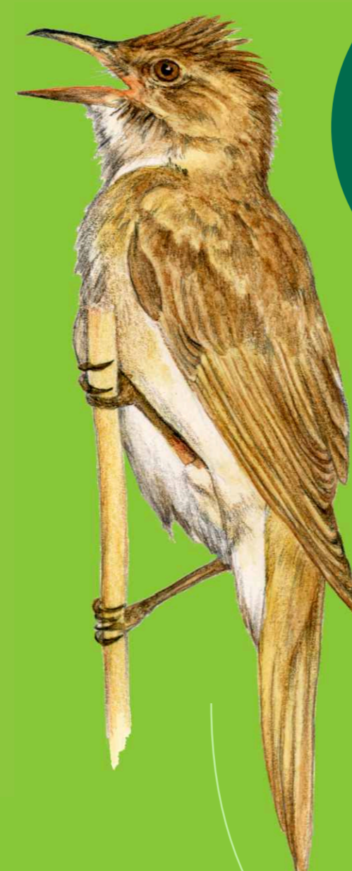
rákosník velký Acrocephalus arundinaceus