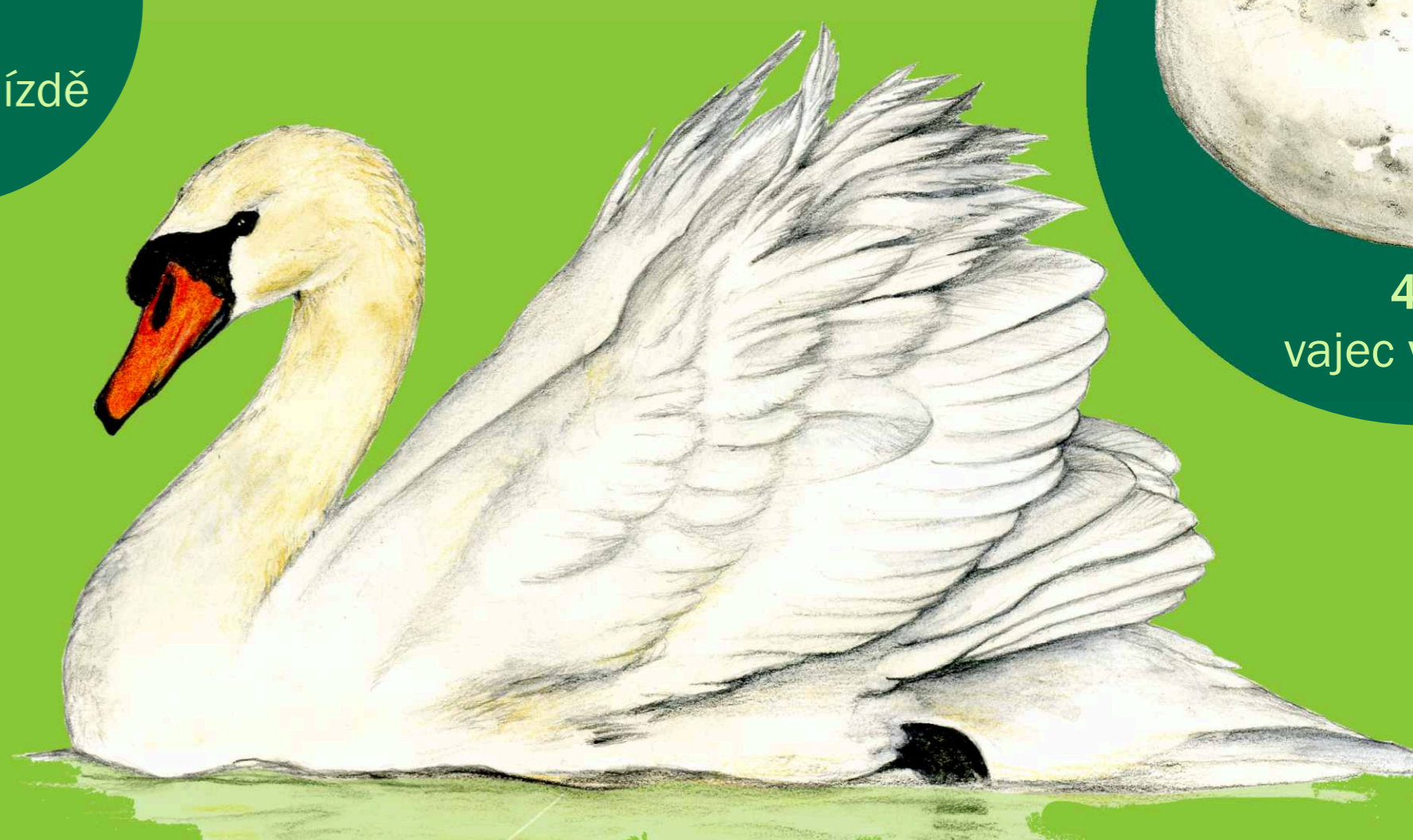
labuť velká Cygnus olor