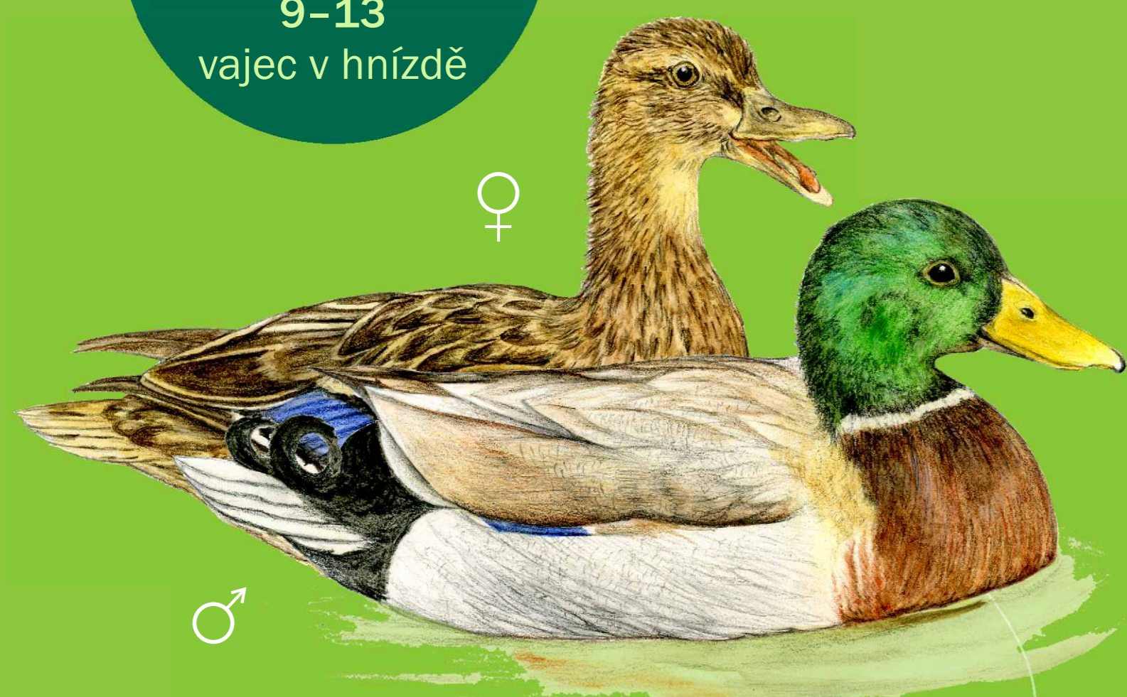
kachna divoká Anas platyrhynchos