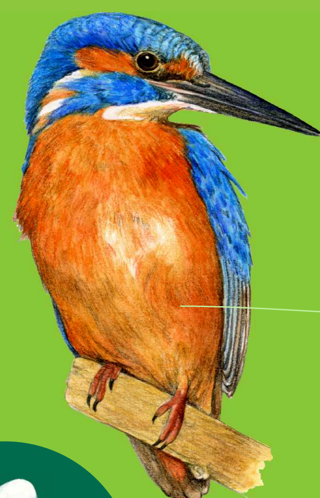
ledňáček říční Alcedo atthis